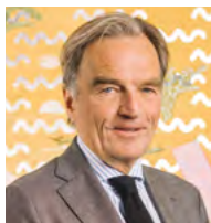
9.8 Réélection de Jean-Philippe Rochat