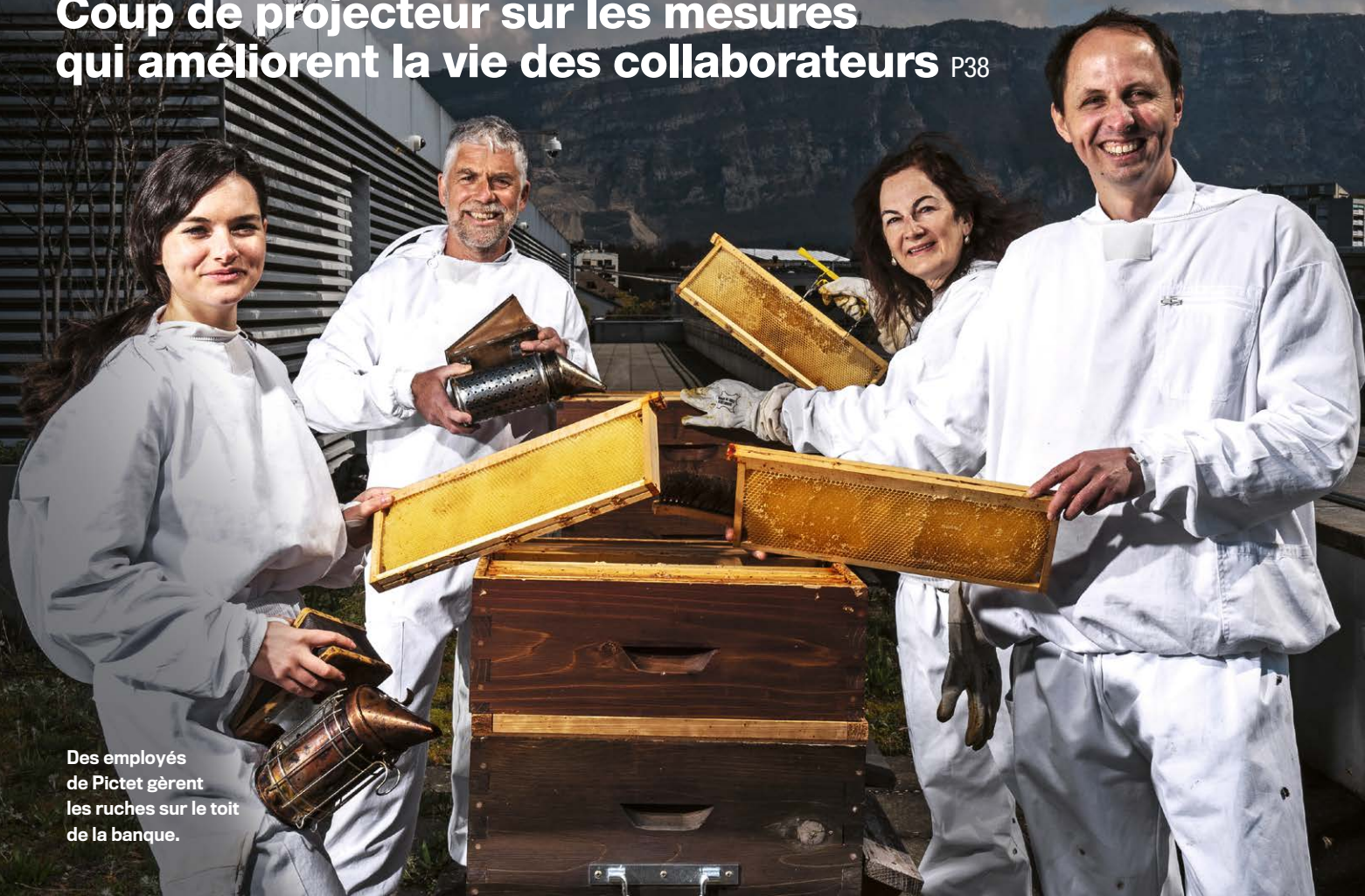
Des employés de Pictet gèrent les ruches sur le toit de la banque.

Coup de projecteur sur les mesures qui améliorent la vie des collaborateurs P38